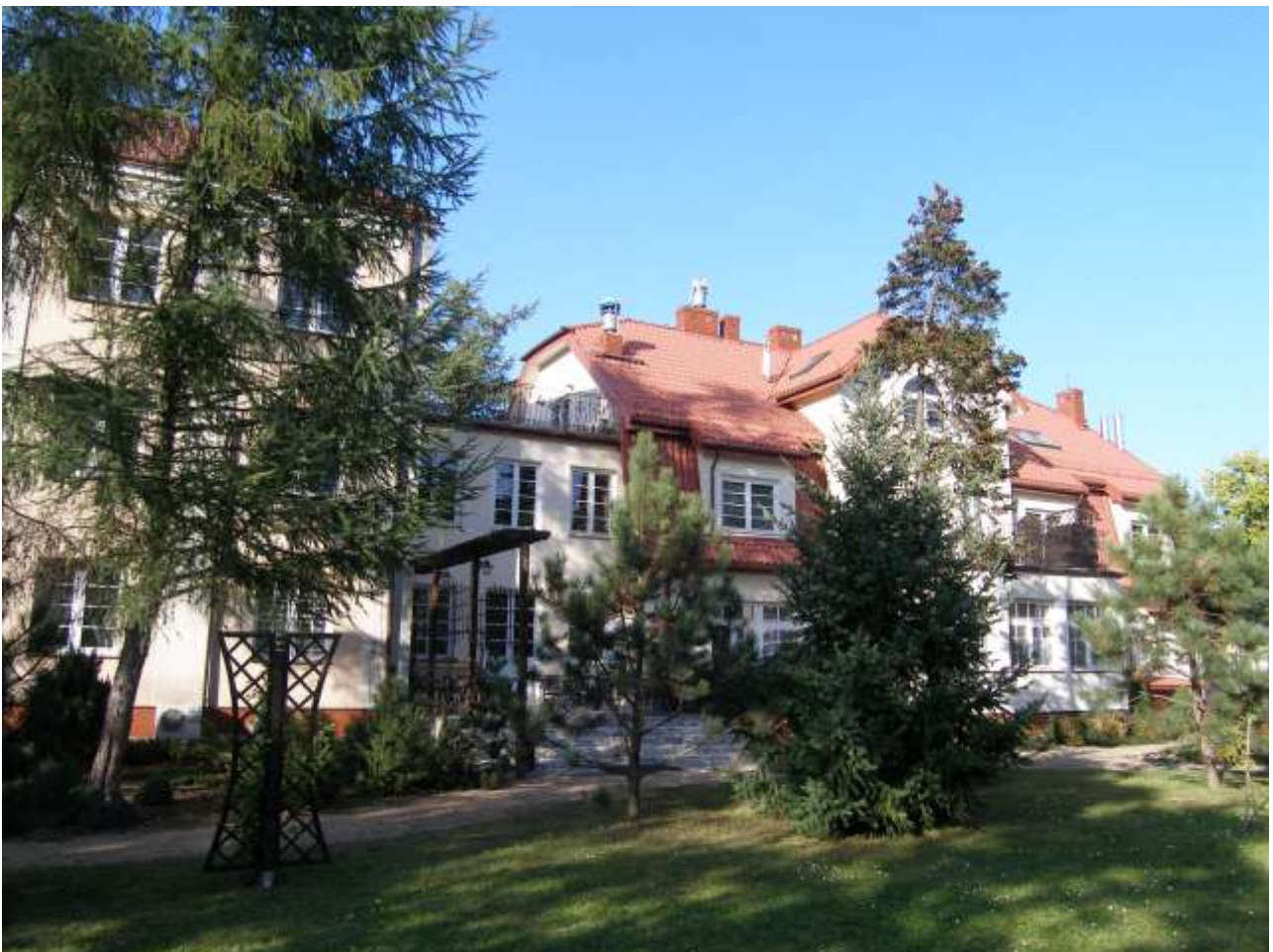
Ilustracja 11: „Helin” - w latach 20-tych nieruchomość Ignacego J. Paderewskiego