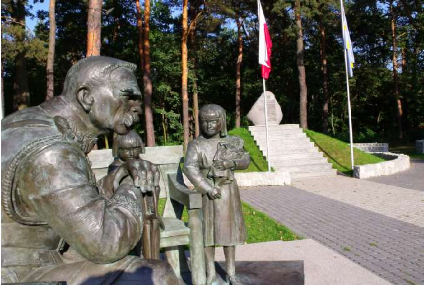
Ilustracja 5: Kopiec Współtwórców Niepodległości Autor: Anna Nagiel