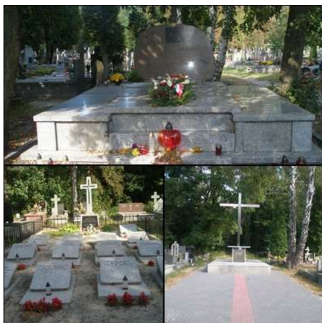
Ilustracja 8: Cmentarz Parafialny w Sulejówku-Miłośnię