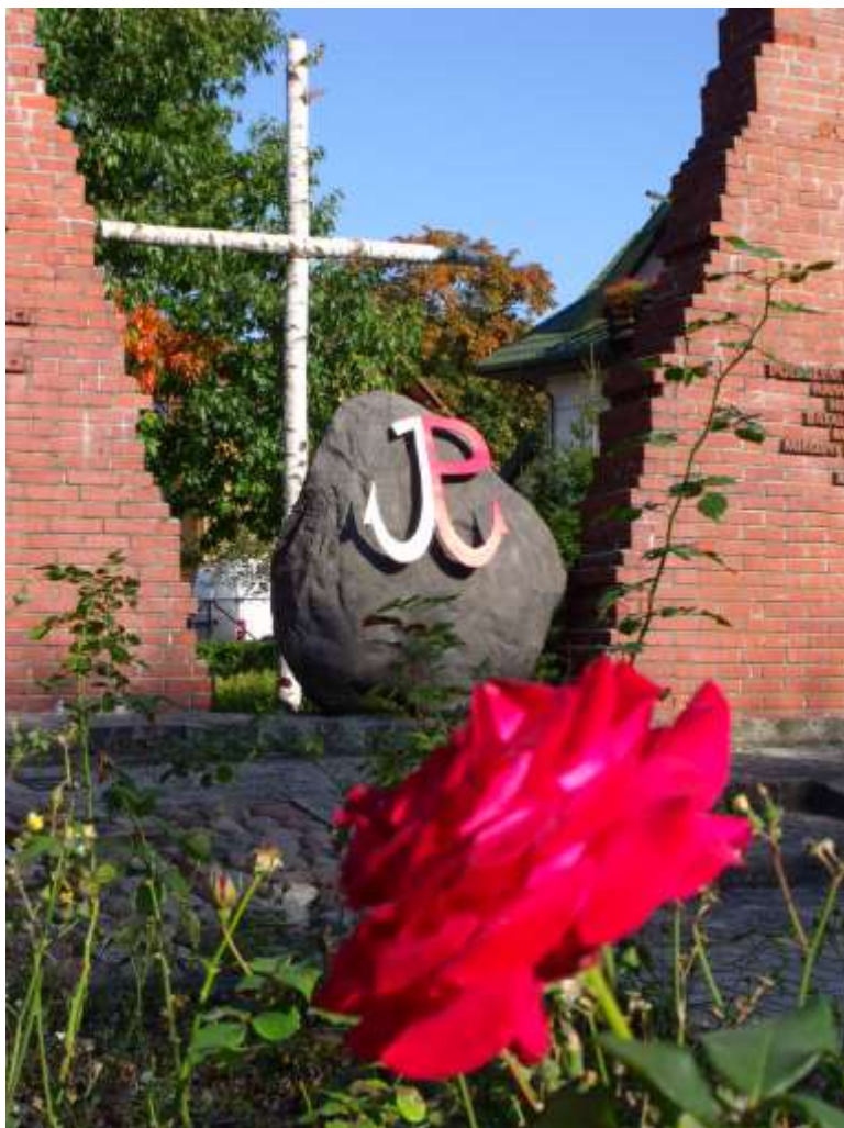
Ilustracja 7: Pomnik żołnierzy AK Batalionu „Zośka”