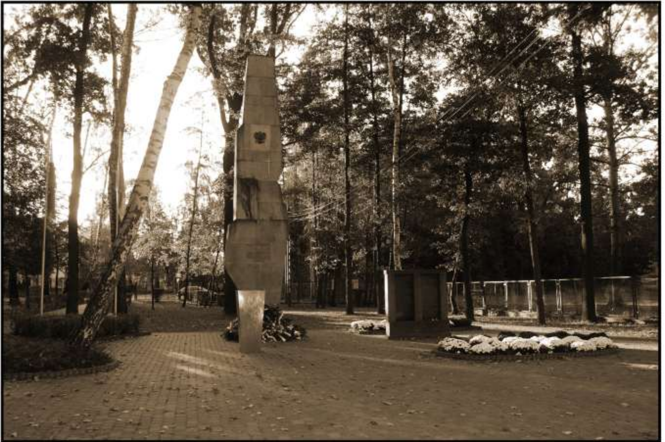
Ilustracja 10: Pomnik Ofiar II Wojny Światowej