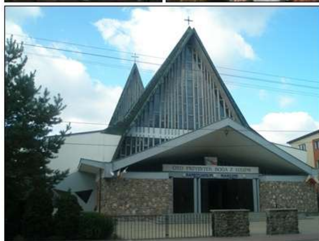
Ilustracja 9: Kościół Parafialny w Sulejówku pw. Maryi Matki Kościoła