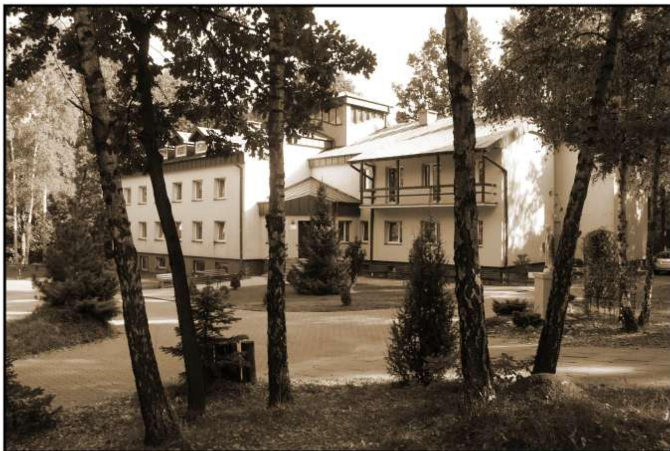
Ilustracja 3: Dom zakonny i rekolekcyjny księży Marianów