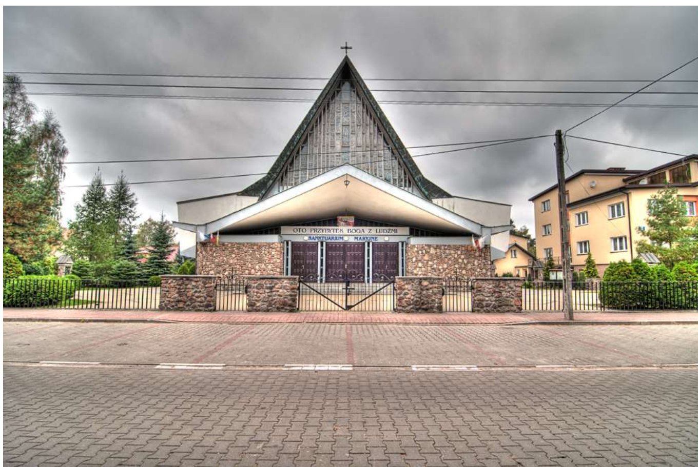
Ilustracja 1: Kościół Parafialny w Sulejówku pw. Maryi Matki Kościoła