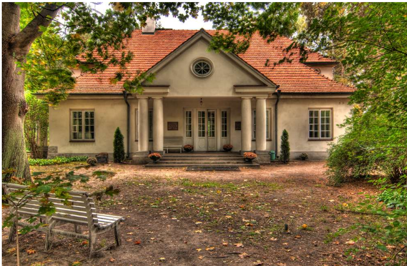
Ilustracja 2: Dworek "Milusin"