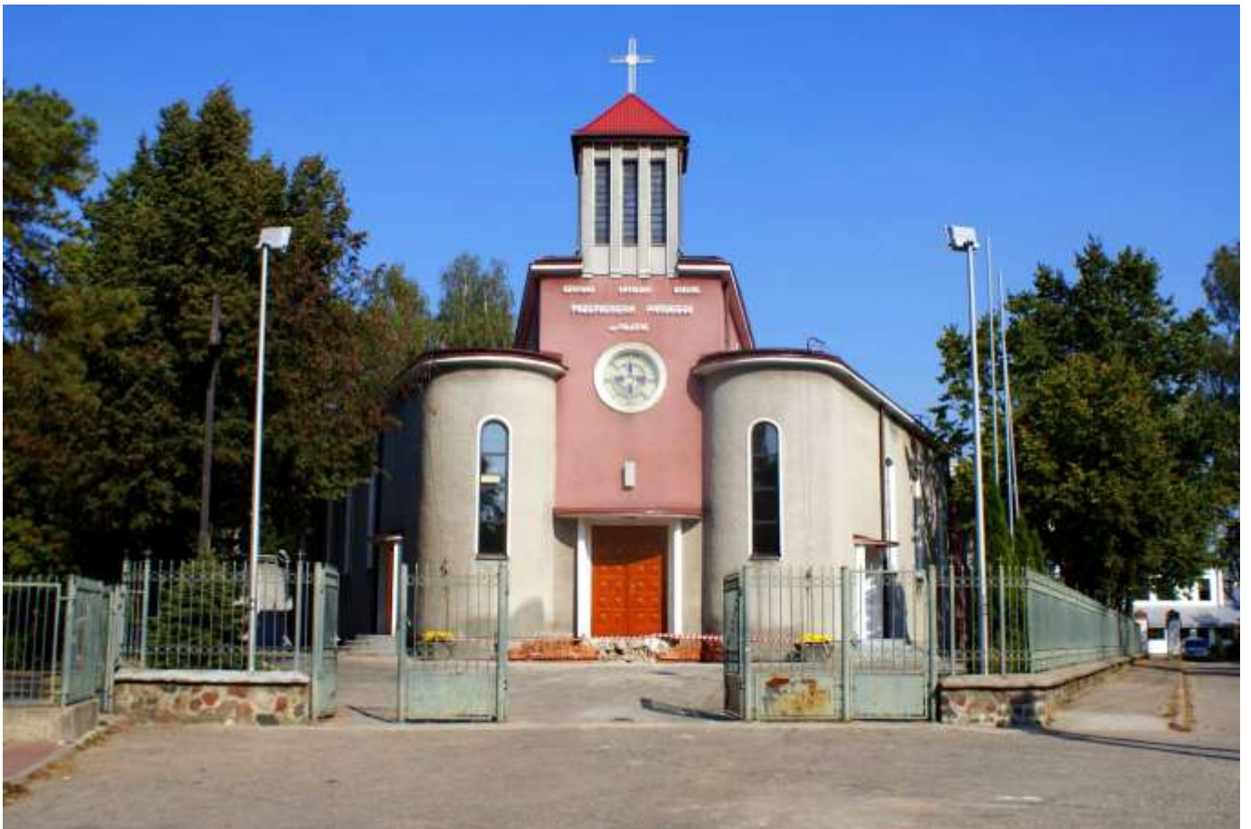
Ilustracja 6: Kościół Parafialny pw. Przemienienia Pańskiego w Sulejówku-Miłośnie Autor: Magdalena Aleksandrowicz